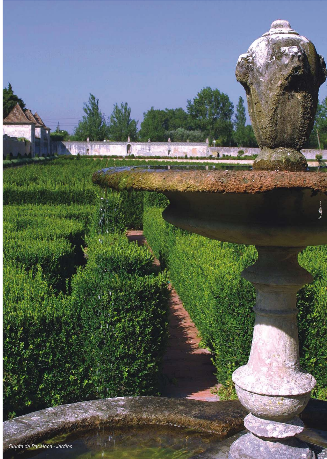
Quinta da Bacalhoa - Jardins