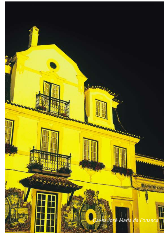
Caves José Maria da Fonseca