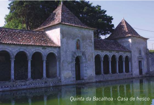
Quinta da Bacalhoa - Casa de fresco