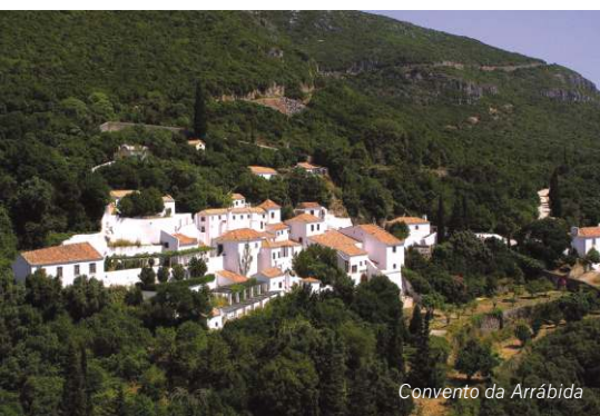
Convento da Arrábida