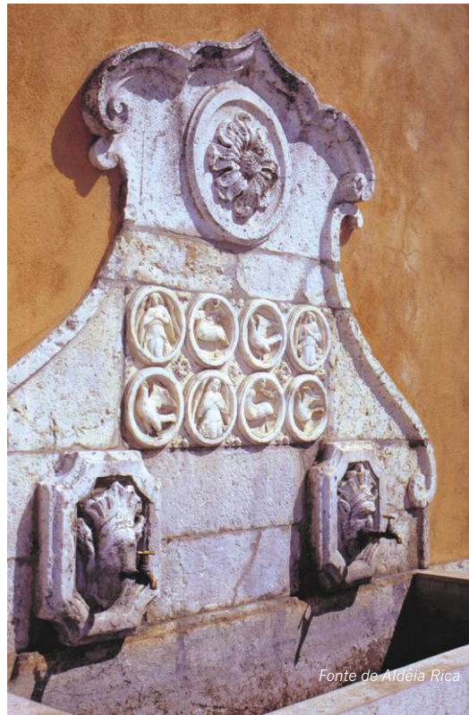
Fonte de Aldeia Rica