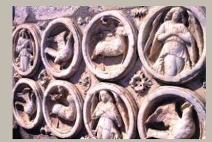
Fonte de Aldeia Rica - pormenor