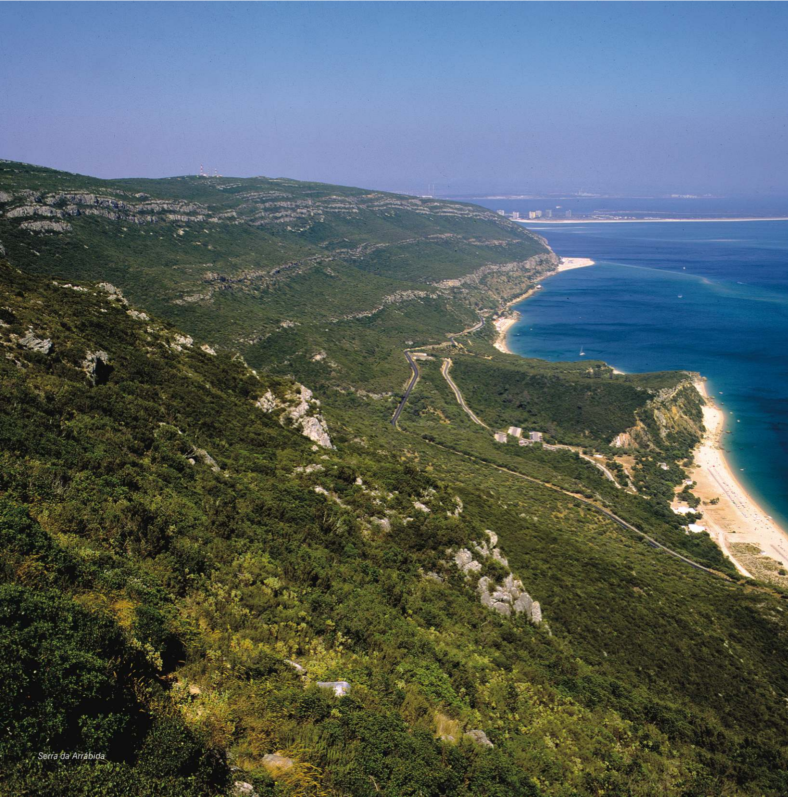
Serra da Arrábida