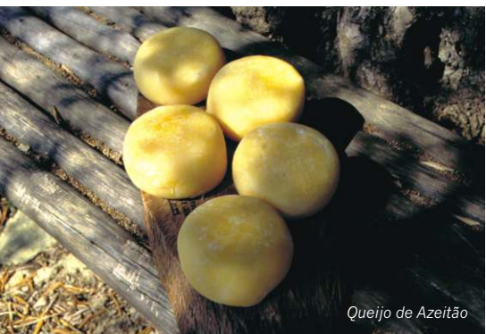
Queijo de Azeitão