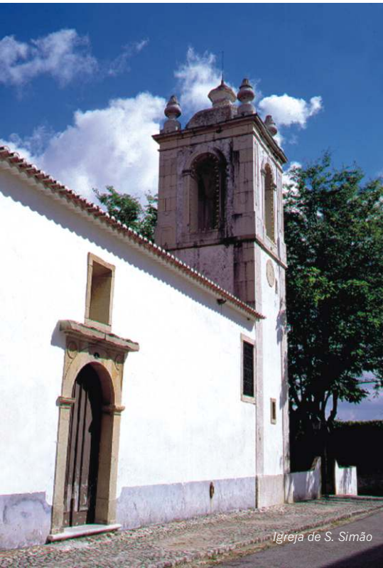
Igreja de S. Simão