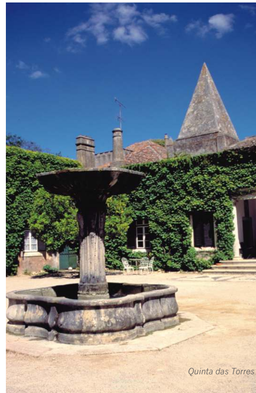
Quinta das Torres