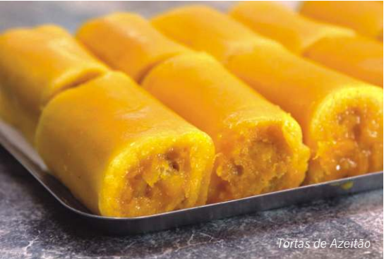
Tortas de Azeitão