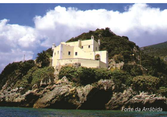
Forte da Arrábida