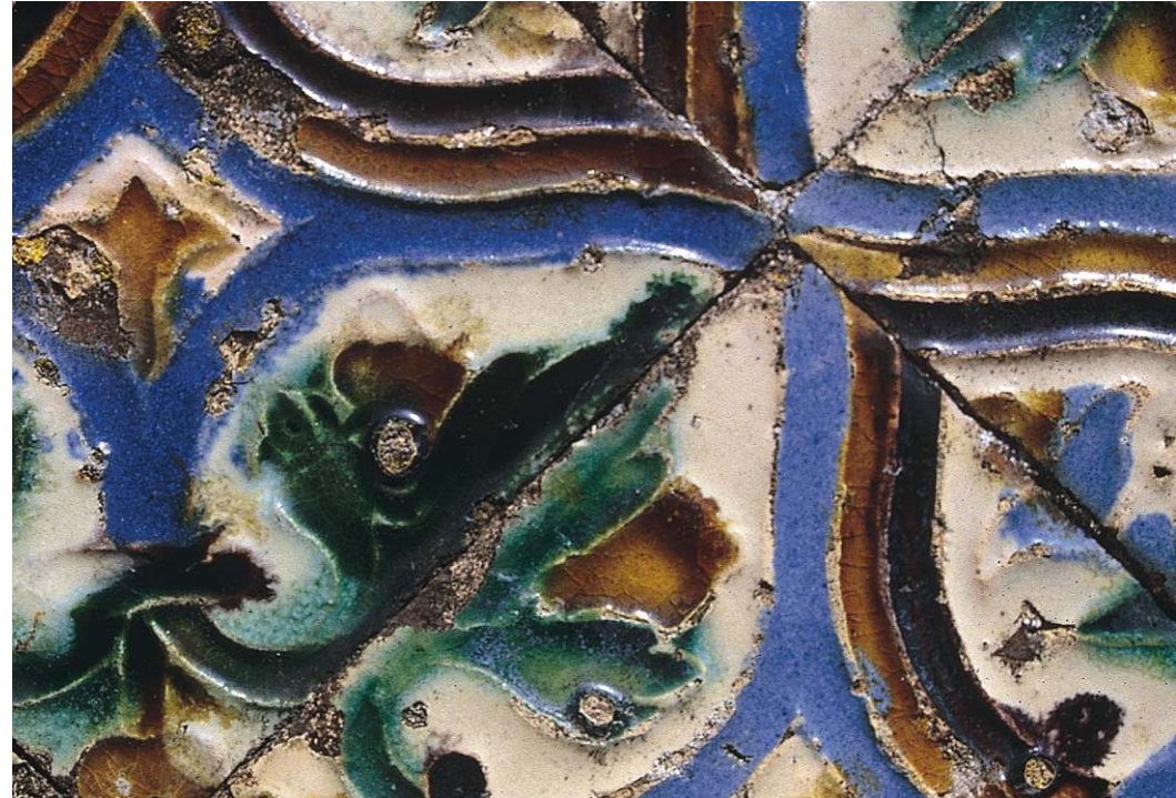
Quinta da Bacalhoa - pormenor de azulejos, Séc. XVI

O aspecto mais notável desta igreja é o revestimento azulejar que cobre totalmente as paredes. Trata-se de azulejos característicos do século XVII, de tipo «tapete», em azul, branco e