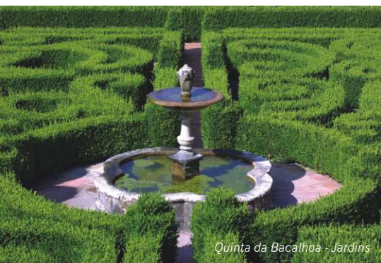
Quinta da Bacalhoa - Jardins